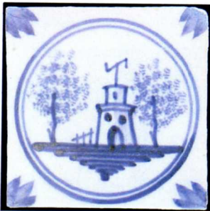
Carreau XVIIIe : Télégraphe aérien