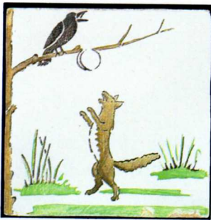
Carreau XIXe : La Fontaine